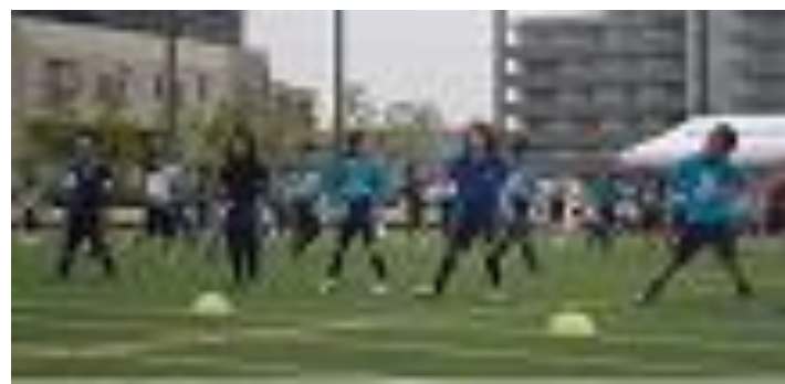
ぼくたち ドラえもん (1年生)

5月26日(土)、第4回小学校運動会を行いました。清々しい気候の中、子供達は一生懸命に演技や競技をしました。1・2年生のかわいい元気いっぱいなダンス、4年生の表現力あふれるダンス、3・5年生の迫力ある民舞、6年生の旗を用いて一致団結した動き等、どれも見応えがありました。短距離走や団体競技、リレー、大玉送りは、赤組、白組ともに迫力があり、応援にも力が入っていました。今年度は、赤組、白組大接戦で、結果は、赤組が勝利をおさめました。