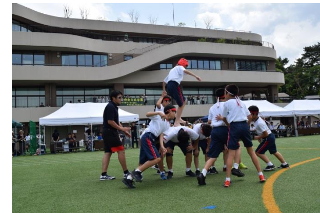
<7学年種目 背中渡り>