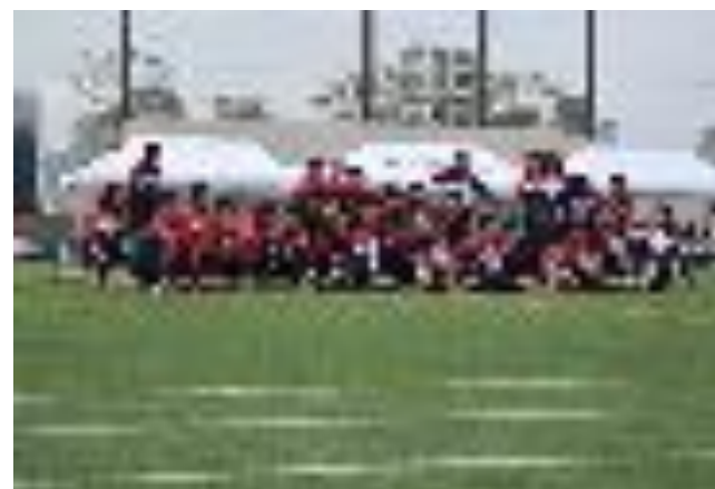
<9年生ダンス 「Beat It」>