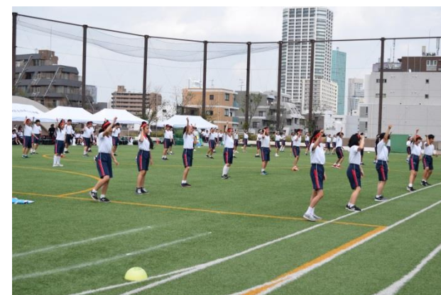
<8学年種目 大漁祭り>