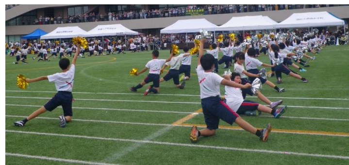
This is me (4年生)