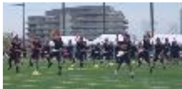
ひびけ! 白丘エイサー (3年生)