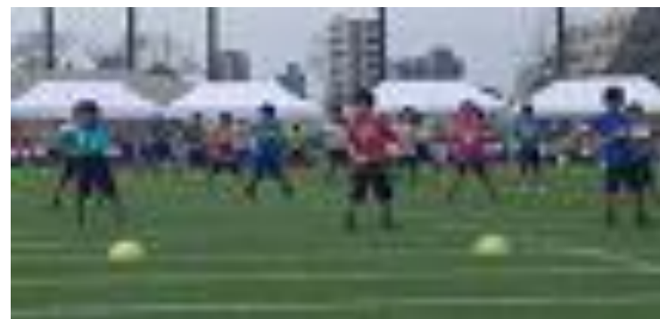
ハイパー ムテキ EXCITE! (2年生)