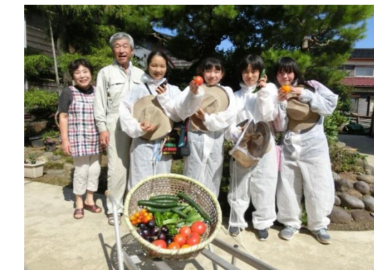
民泊先にて野菜の収穫

夕飯の おかずのための 魚釣り 初畑 努力した分 腹減った 民泊の 家の近くに 海がある みずみずしい 割れたスイカは 夏の味 光るもの それはおいしい 野菜たち 星空と 線香花火 きれいだね スイカ割 花火バーベキュー 楽しいな