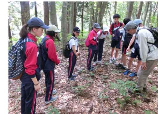
森の学校「キョロロ」にてブナ林散策

森の中 不思議がいっぱい 楽しいな 蛇を見て 首に巻いて 怖かった 森の中 マイナスイオン 感じれる 虫の声 自然の中で 音を聞く 茎は赤 触れたらかぶれる モリウルシ 美人林 通ったら美人に になれるかな 夜闇に 輝き放つ ホタルたち