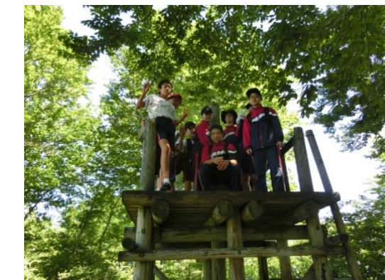
菱ヶ岳にてトレッキング

山登り かぶれる草が 怖かった ブナ林 美しい世界が 見えるかな 山登り 自然を感じる 良い機会 涼しげに 木漏れ日漏れる 夏の山 ハイキング ぬかるみハマって さあ大変 コシヒカリ つやつやもちもち ああうまい 明日から 民泊手伝い 頑張るよ