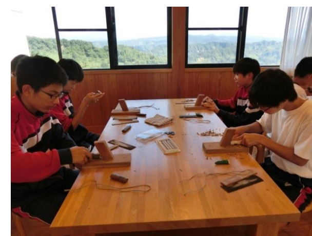
[ 2日目 工芸体験（木の笛づくり） ]