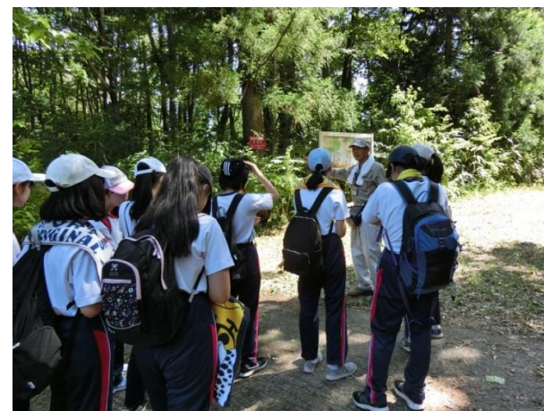
[ 1日目 森の学校キョロロにて散策 ]

4日間、自然の中ならではの活動を行うことができました。いろいろな方々との交流や体験の中で、人の優しさに触れ、コミュニケーションの大切さなどを学びました。この夏の経験は、大きな成長につながっていくと思います。