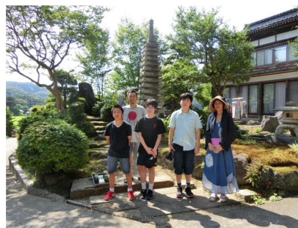
[ 3日目 民泊体験 ]