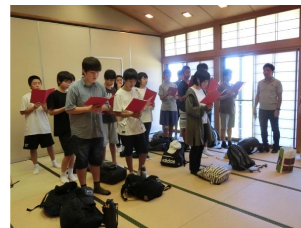
[ 4日目 お別れ会 ]